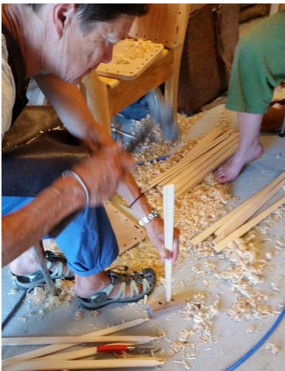
Drude slår den spikkede enden av staken ned i en kloss av hardved med borede hull for å få formet enden på spilen. Ferdige og uferdige spiler ligger på gulvet.