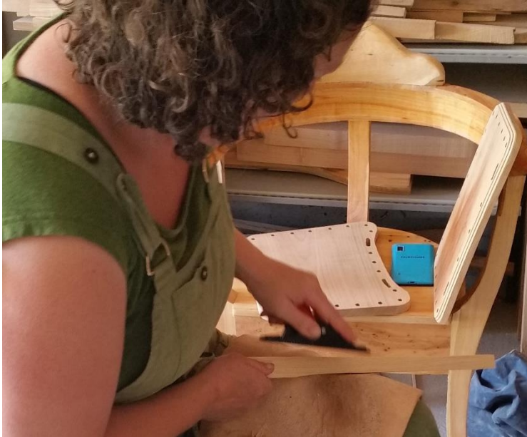
Hege høvler spile med en liten sponhøvel.

32 x 25 cm. Det er laget en liten avrunding for ryggen og en liten bue utover på motsatt side. Bunnplata er pyntet litt på ved at det er frest staff på kanten. Det er saget ut avlange åpninger med stikksag for to kraftigere spiler i det som blir ryggstøtten av kipa. Hull til staker er også boret og vi kan legge merke til at det er boret 21 hull. Det må være oddetall for at flettinga skal gå opp. Hull ble boret med 8 mm bor og er boret litt på skrå for at spilene skal få skrå litt utover, slik at kipa skal bli videre oppe enn nede. Spiler i furu kappes og økses eller sages til ønsket form og høvles. Både bunn og spiler bør være av godt tørket virke.