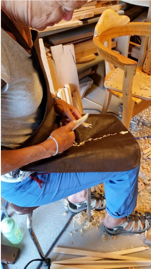
Staken spikkes i fasong for å få ende som kan drives ned i hull i bunnplata.