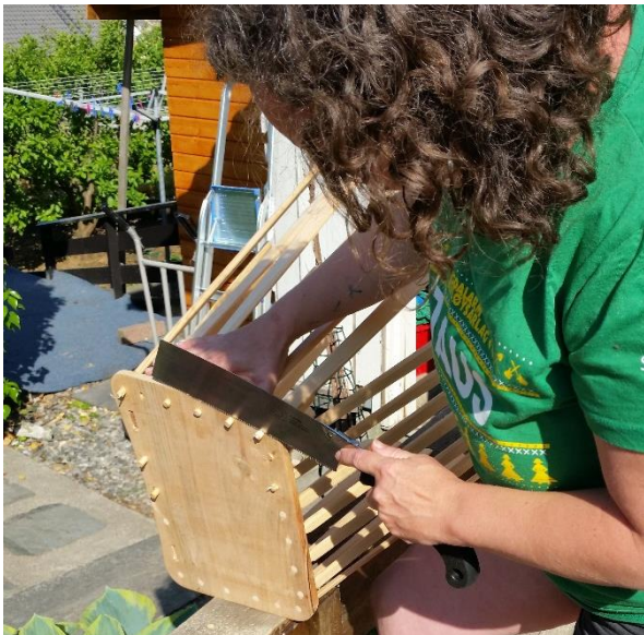
Hege kapper av stakeendene jevnt med utsiden av bunnplata. Etter at flettingen er ferdig, skal det skrues på to labanker på kortendene som skal tjene som sokkel på kipa.